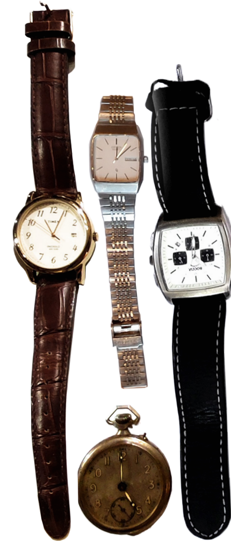
Uhren 4 Sammlungen Anzahl 8