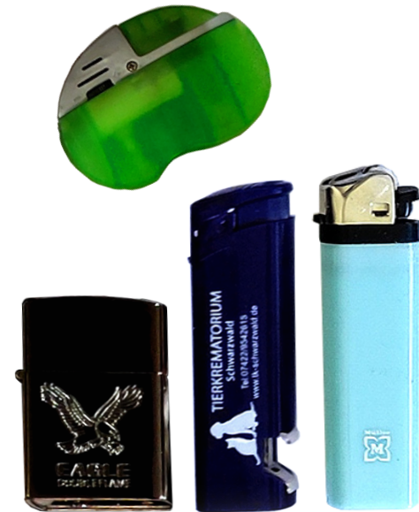
Feuerzeuge 4 Sammlungen Anzahl 6