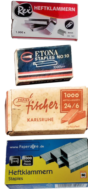
Heftklammern 4 Sammlungen Anzahl 10