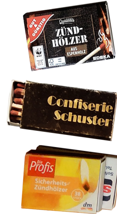
Streichholz- schachteln 4 Sammlungen Anzahl 11