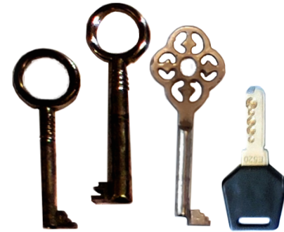
Schlüssel 4 Sammlungen Anzahl 11