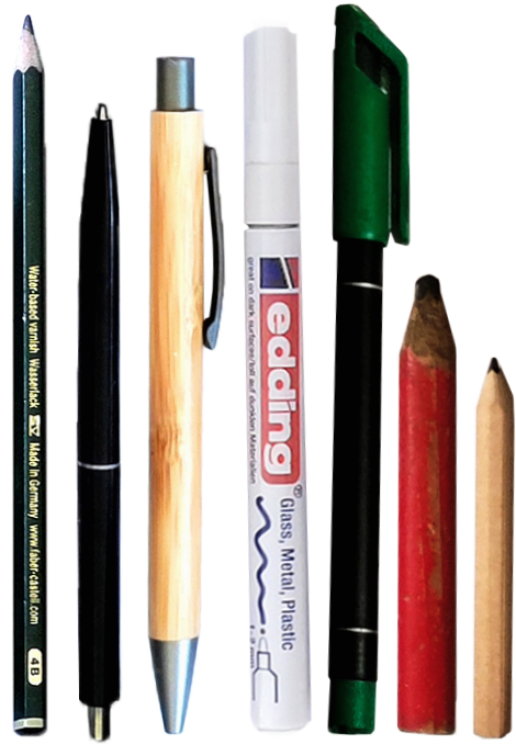
Stifte+Marker 7 Sammlungen Anzahl 26

Diese Gegenstände finden sich in mehreren Krams-Sammlungen: