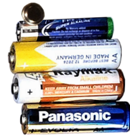
Batterien 5 Sammlungen Anzahl 82