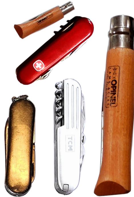
Taschenmesser 5 Sammlungen Anzahl 7